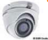
Dimensiones: 91 x 82.6 x 68.3 mm