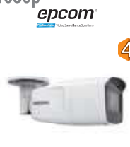
Dimensiones: 256,4 x 83,3 x 78,2 mm