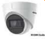
Dimensiones: 109.82 x 91.03 mm