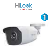
Dimensiones: 75,4 x 230,8 x 87,2 mm