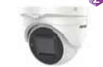
Dimensiones: 123.86 x 134.3 x 110.11 mm