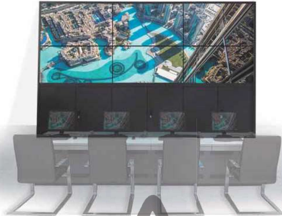
(Monitores, sillas y escritorios no incluidos)