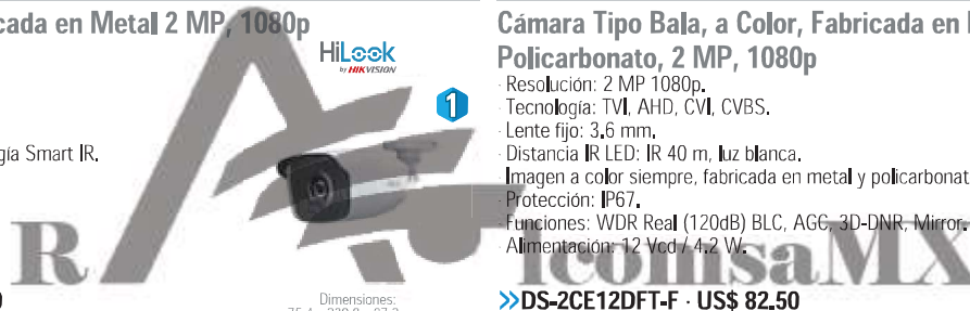
Dimensiones: 75,4 x 230,8 x 87,2 mm.