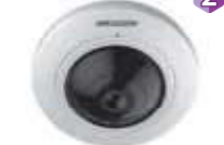
Dimensiones: 120.4 x 54.5 mm.