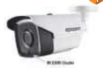
Dimensiones: 86.7 x 81.6 x 226 mm.