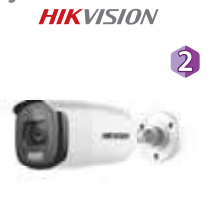
Dimensiones: 223,1 x 77,1 x 82,6 mm