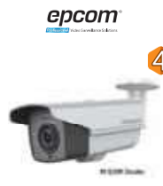
Dimensiones: 313,5 x 100,8 x 107,3 mm