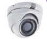
Dimensiones: 91 x 82.6 x 68.3 mm.