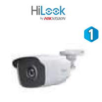
Dimensiones: 75,4 x 230,8 x 87,2 mm