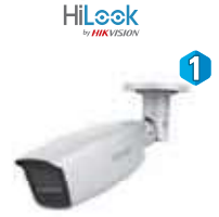
Dimensiones: 256,40x 83,3 mm