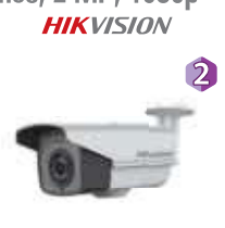
Dimensiones: 313,5 x 100,8 x 107,3 mm