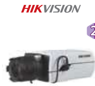
Dimensiones: 69,2 x 59,3 x 148,7 mm