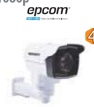
Dimensiones: 153 x 93 x 130 mm