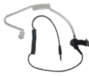
ES-02 Tubo acústico con conector 3.5 mm