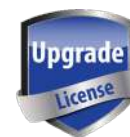
SW00073 Licencia para función de grabación c/tarjeta TF