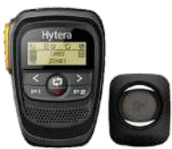
SM27W1 Micrófono y bocina bluetooth