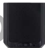
BP3501 Batería de polímero de Litio