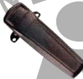
BC08 Clip atornillable con resorte