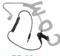
ES-02 Tubo acústico con conector 3.5 mm