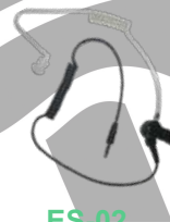
ES-02 Tubo acústico con conector 3.5 mm