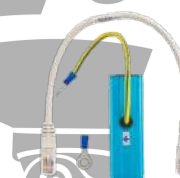
POA45 Protector de descargas