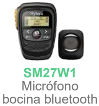
SM27W1 Micrófono bocina bluetooth US$ 324.00

»Modelo: MD-656V-1 VHF 136-174 MHz Potencia: 1/25 W »Modelo: MD-656U-1 UHF 400-470 MHz Potencia: 1/25 W Canales: 1024 Precio: US$ 409.00