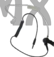
ES-02 Tubo acústico con conector 3.5 mm