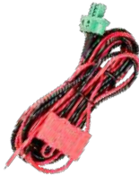
PWC31 Cable de alimentación CD