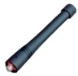
AN0445H03 Antena UHF Stubby, 420-470 MHz