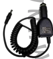
CHV09 Cargador vehicular