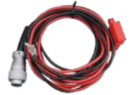
PWC11 Cable de alimentación