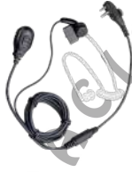
EAM13 Audifono microfono 2 hilos con VOX y tubo acustico