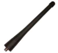
AN0160H13 Antena VHF 146-174 MHz 15.30 cm