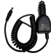
CHV09 Cargador vehicular