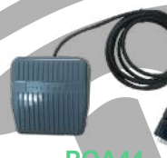
POA44 Interrupción de pie