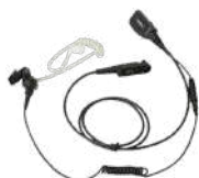
EAN22 Aurifono micrófono acústico