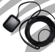
GPS04 Antena GPS 1575 MHz c/ cable 3 m