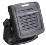
SM09D1 Bocina externa US$ 61.00