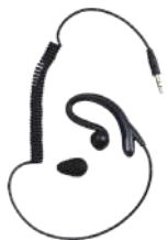
EH-01 Audífono estilo C