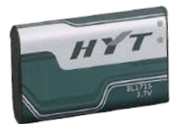
BL1715 Batería Li-Ion, 1700 mAh