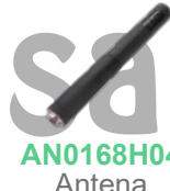
AN0168H04 Antena Stubby VHF, 9 cm 163-174 MHz