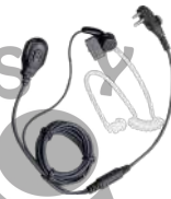
EAM13 Audifono micrófono 2 hilos, VOX y tubo acústico