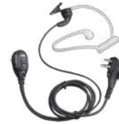
EAM12 Audífono micrófono VOX y tubo acústico