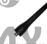
AN0435H13 Antena Stubby UHF, 400-470 MHz, 9 cm