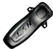
BC16 Clip Atornillable con resorte US$ 3.00