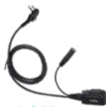
ACM-01 Micrófono con PTT, require ES-01/ES-02 EH-01/EH-02