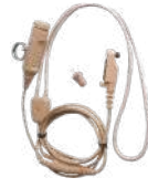
EWN07 Audífono inalámbrico