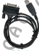
PC40 Cable de datos