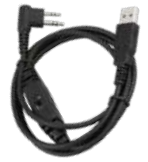
PC63 Cable de programación