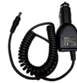
CHV09 Cargador vehicular