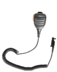
SM26N1 Micrófono remoto IP67