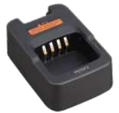
CH10A04 Cargador Rapido MCU (Li-Ion)