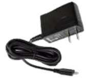
PS1030 Cargador USB 110/220V