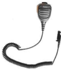
SM26N1 Micrófono bocina IP67