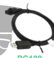
PC109 Cable de programación