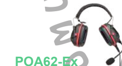
POA62-Ex Auricular de trabajo pesado IS ATEX