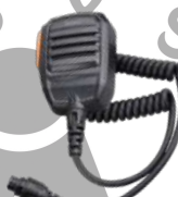
SM16A1 Micrófono remoto IP54