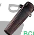
BC08 Clip atornillable c/resorte para: PD606/606G