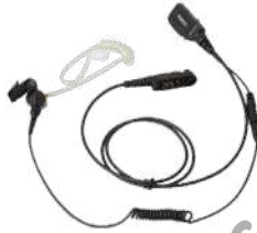
EAN22 Audífono tipo tubo acústico