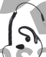
EH-01 Aurifono estilo C US$ 12.00