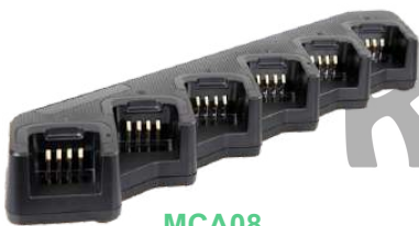
MCA08 Cargador múltiple para 6 unidades