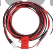
PWC10 Cable de alimentación