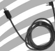
PC26 Cable USB programador