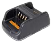
CH10A06 Cargador doble con adaptador PS2005