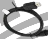
PC109 Cable de programación US$ 42.00