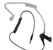
ES-02 Tubo acústico con conector 3.5 mm US$ 24.00