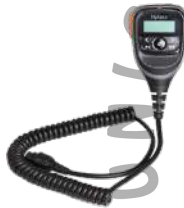
SM25A1 Micrófono c/pantalla 3 metros, IP54 US$ 111.00