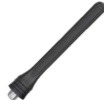
AN0435H19 Antena UHF, 400-470 MHz, 9 cm US$ 6.00