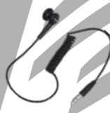
ES-01 Audifono con conector 3.5 mm