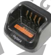
CH10L27 Base de cargador