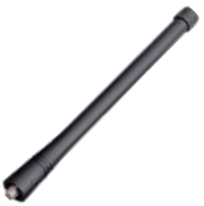
AN0160H13 Antena VHF, 146-174 MHz, 15 cm