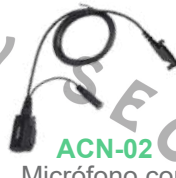
ACN-02 Micrófono con PTT. Requiere ES-01 / ES-02 EH-01 / EH-02