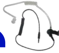
ES-02 Auricular con tubo transparente