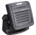
SM09D1 Bocina externa US$ 61.00