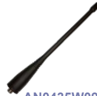
AN0435W09 Antena UHF 400-470 MHz 16 cm