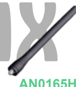
AN0165H01 Antena VHF 156-174 MHz, 17 cm