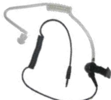
ES-02 Tubo acústico c/ conector 3.5 mm