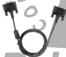
POA147 Cable Backup