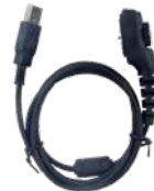
PC38 Cable de programación