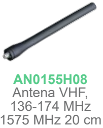
AN0155H08 Antena VHF, 136-174 MHz 1575 MHz 20 cm