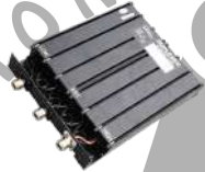
DT11 Duplexer 380-470 MHz, Separación de frec. 5 MHz