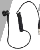
ES-01 Aurifono con conector 3.5 mm