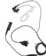
EAN24 Audífono tipo tubo acústico