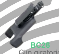
BC26 Clip giratorio p/cinturón: PD666/666G PD686/686G