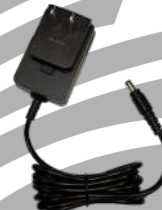
PS1014 Eliminador para cargador