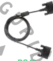
PC49 Cable espalda con espalda