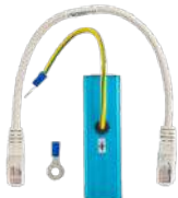
POA45 Protector de descargas