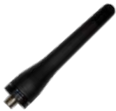
AN0435H13 Antena 9 cm 400-470 MHz