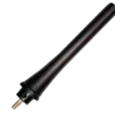
AN0460H11 Antena UHF Stubby, 450-470 MHz