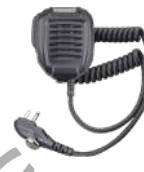
SM08M3 Micrófono de solapa IP54