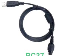
PC37 Cable de programador