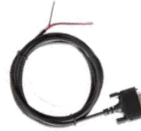
PC60 Cable de ignición