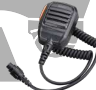
SM16A1 Micrófono remoto IP54