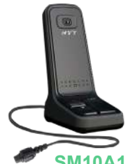
SM10A1 Micrófono de escritorio