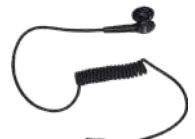
ES-01 Audífono con conector 3.5 mm