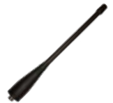
AN0435W09 Antena Flexible UHF, 400-470 MHz, 16 cm