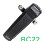
BC22 Clip para: PD666/666G PD686/686G