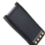
BL1703 Bateria Li-Ion, 1700 mAh