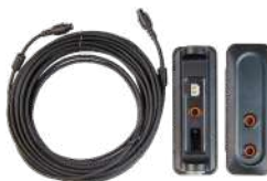
RCC33 Kit de montaje remoto 3 m