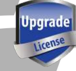
SW00060 Licencia Roaming