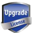
SW00064 Licencia de encriptación básica y pseudotrunking