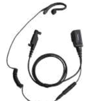
EHN21 Audífono con micrófono