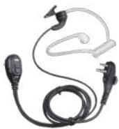
EAM12 Audifono micrófono con VOX y tubo acústico