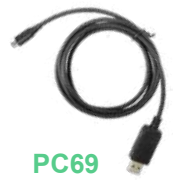
PC69 Cable de programación US$ 43.00