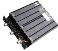
DT11 Duplexer 380-470 MHz, Separación de frec. 5 MHz