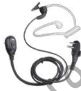
EAM12 Audifono micrófono, VOX y tubo acústico