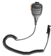
SM26N2 Micrófono remoto IP54 c/conector audio externo 2.5mm