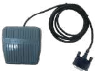
POA44 Interruptor de pie US$ 60.00