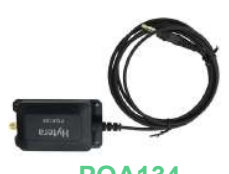
POA134 Modulo externo de GPS