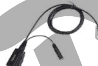
ACN-01 Micrófono con PTT. Requiere ES-01/ES-02 EH-01/EH-02