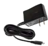
PS1030 Eliminador para cargador US$ 15.00

» Modelo: BD-302U UHF 400-470 MHz Potencia: 1/2 W Canales: 48 Precio: US$ 163.00