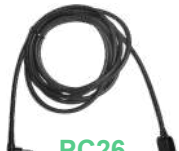
PC26 Cable USB programacion