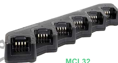
MCL32 Cargador Múltiple para 6 unidades