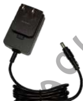
PS1014 Eliminador para cargador