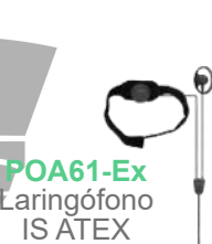
POA61-Ex Laringófono IS ATEX