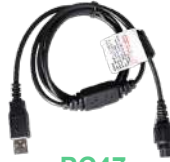
PC47 Cable de programación, actualización de firmware