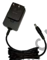
PS1014 Eliminador para cargador