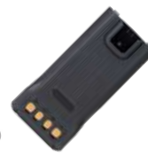
BP2002 Bateria recargable de polimero de Li-Ion de 2000 mAh