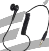
ES-01 Aurifono con conector 3.5mm US$ 9.00