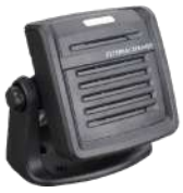
SM09D1 Bocina externa