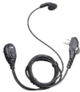
ESM12 Audifono micrófono con VOX