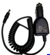
CHV09 Cargador vehicular US$ 65.00