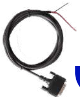
PC60 Cable de ignición US$ 51.00