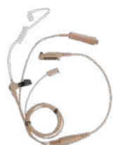
EAN21 Audífono de vigilancia