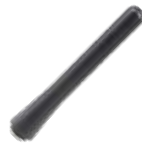
AN00435H26 Antena UHF/GPS STUBBY 136-174 MHz