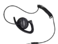
EH-02 Audífono giratorio