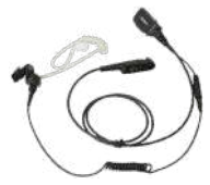
EAN22 Audífono tipo tubo acústico