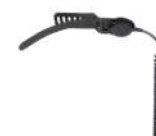
POA101-Ex Manos Libres Intrínsecamente seguro