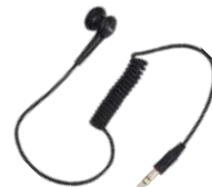
ES-01 Audífono con conector 3.5 mm