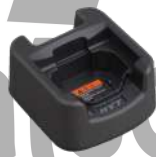
CH05L01 Base para cargador