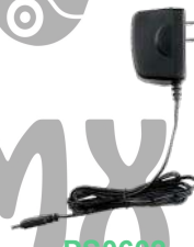
PS0602 Eliminador p/ cargador CH05L01