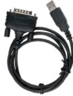
PC40 Cable de datos