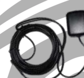
GPS04 Antena GPS 1575 MHz, c/cable 3 m. US$ 21.00