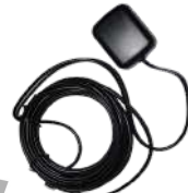
GPS04 Antena GPS 1575 MHz, c/cable 3 m US$ 21.00