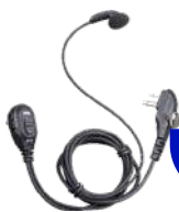
ESM12 Audifono microfono con VOX