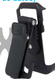
BC40 Clip de cinturón US$ 19.00