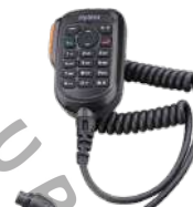
SM19A1 Micrófono con teclado