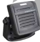
SM09D1 Bocina externa