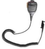
SM26N1 Micrófono bocina IP67