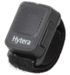
POA47 PTT con Bluetooth