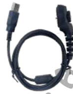
PC38 Cable de programación