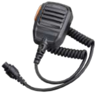
SM16A1 Micrófono remoto IP54