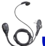
ESM12 Audifono microfono c/VOX