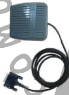
POA44 PTT de pedal