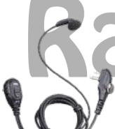
ESM12 Audifono micrófono con VOX