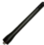
AN0167H08 Antena VHF/GPS 160-174 MHz 12 cm