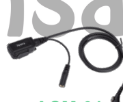
ACM-01 Micrófono con PTT, require ES-01/ES-02 EH-01/EH-02