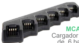
MCA08 Cargador múltiple de 6 baterías