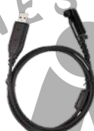
PC152 Cable de programación