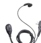
ESM12 Audífono micrófono con VOX