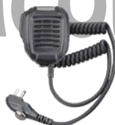
SM08M3 Micrófono bocina IP54