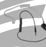
ES-02 Tubo acústico c/ conector 3.5 mm