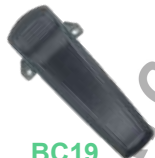
BC19 Clip atornillable con resorte