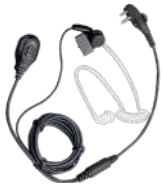
EAM13 Audífono micrófono 2 hilos con VOX y tubo acústico