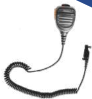
SM26N2 Micrófono bocina IP54 c/conector audio 2.5mm