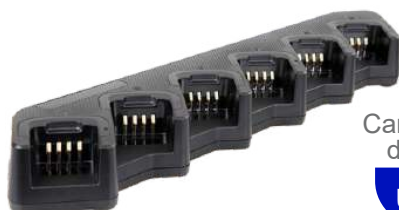
MCA08 Cargador múltiple de 6 baterías