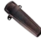
BC08 Clip deslizable p/batería