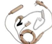
EAN06 Audifono microfono 3 hilos