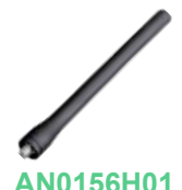
AN0156H01 Antena VHF 147-165 MHz, 17 cm