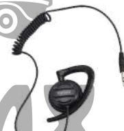
EH-02 Aurifono giratorio US$ 14.00