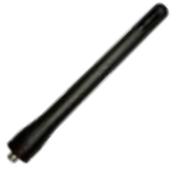
AN0141H07 Antena VHF/GPS 136-174 MHz 12 cm