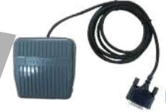
POA44 PTT de pedal US$ 60.00