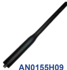
AN0155H09 Antena VHF/GPS 136-174 MHz 20 cm