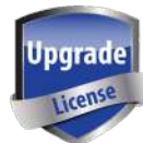
SW00012 Licencia de Roaming