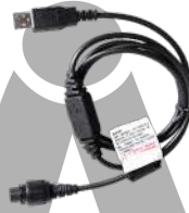
PC47 Cable de programación y actualización