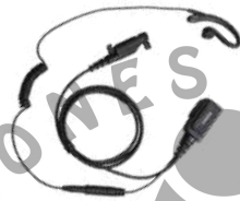
EHN26 Audífono Micrófono