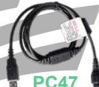
PC47 Cable de programación y actualización de firmware US$ 50.00