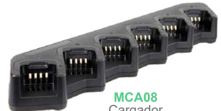
MCA08 Cargador multiple de 6 baterías