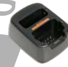
CH10L16 Cargador doble Serie X1