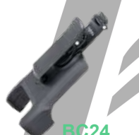
BC24 Clip giratorio p/cinturón PD606/606G