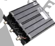
DT23 Duplexer 136-174 MHz Separación de frec. 3.8 MHz