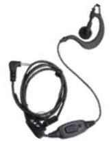
EHS09-A Audífono micrófono c/VOX