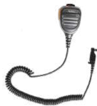
SM26N2 Micrófono bocina IP54 c/conector audio 2.5mm