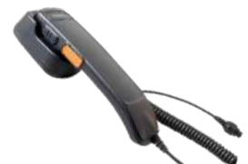
SM20A2 Micrófono con DTMF estilo teléfono