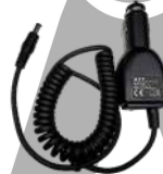
CHV09 Cargador vehicular