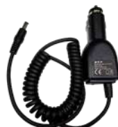
CHV09 Cargador vehicular