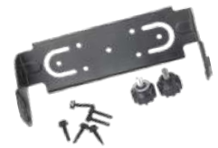
BRK08 Bracket metálico