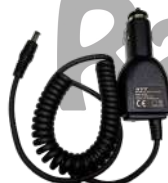
CHV09 Cargador vehicular