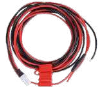
PWC10 Cable de alimentación