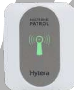
POA71 Punto de verificación RFID