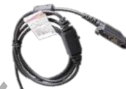
PC45 Cable de programación