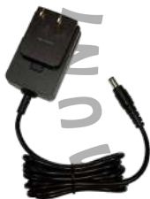
PS1014 Eliminador para cargador