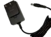
PS1014 Eliminador p/ cargador