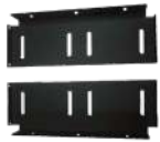
BRK19 Bracket p/ pared