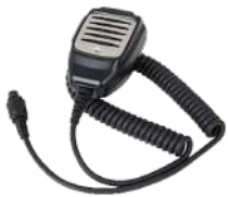
SM11A1 Micrófono de mano