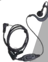
EHS12-A Audífono micrófono