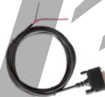
PC60 Cable de ignición