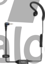
EHS16 Aurifono micrófono US$ 12.00