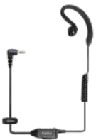
EHS16 Audífono micrófono