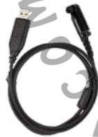
PC152 Cable de programación