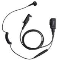
ESN14 Audífono micrófono