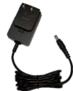
PS1014 Eliminador p/cargador