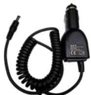
CHV09 Cargador vehicular