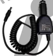
CHV09 Cargador vehicular