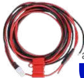
PWC10 Cable de alimentación US$ 32.00