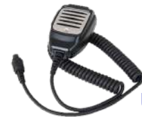
SM11A1 Micrófono de mano US$ 43.00