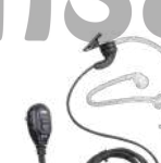
EAM12 Audifono microfono VOX y tubo acustico