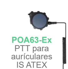
POA63-Ex PTT para auriculares IS ATEX