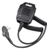
SM26M1 Micrófono bocina IP54