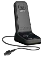
SM10A1 Micrófono de escritorio