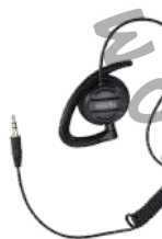
EH-02 Audífono giratorio