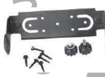
BRK29 Bracket de instalación US$ 20.00