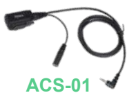
ACS-01 Micrófono con PTT requiere ES-01/ES-02 EH-01/EH-02