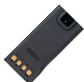
BP2403 Batería recargable de polímero de Li-Ion de 2400 mAh