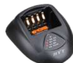
CH10L07 Base de cargador