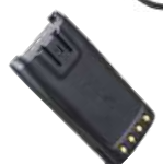
BL2102 Bateria Li-Ion, 2100 mAh