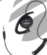
EH-02 Audífono giratorio