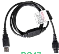
PC47 Cable de programación, actualización de firmware