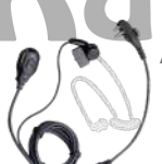
EAM13 Audifono microfono 2 hilos con VOX y tubo acustico