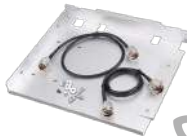
BRK09 Bracket para duplexer interno p/ DT11, DT23