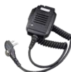
SM26M1 Micrófono bocina IP55