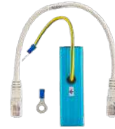
POA45 Protector de descargas