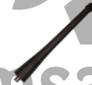
AN0160H13 Antena VHF, 146-174 MHz