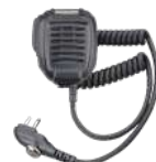
SM08M3 Micrófono bocina IP54