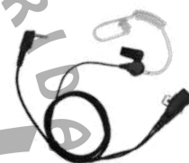
EAM1320 Audífono micrófono con tubo acústico