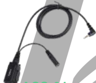
ACS-01 Micrófono con PTT requiere ES-01/ES-02 EH-01/EH-02 US$ 23.00