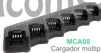
MCA08 Cargador múltiple de 6 baterías