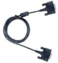
PC110 Cable espalda a espalda DB26 a DB26