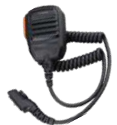
SM18N2 Micrófono bocina IP67, UL913