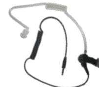
ES-02 Tubo acústico c/ conector 3.5 mm