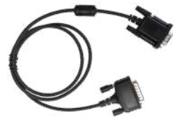
PC142 Cable Wireless link Espalda a espalda DB9-DB26