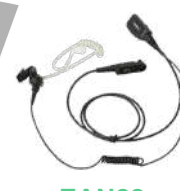
EAN22 Audífono micrófono acústico