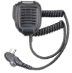
SM08M3 Microfono bocina IP54