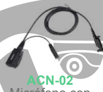
ACN-02 Micrófono con PTT. Requiere EH-01 / EH-02 ES-01 / ES-02