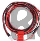
PWC10 Cable de alimentación US$ 32.00