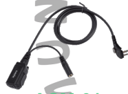
ACM-01 Microfono con PTT, requiere ES-01/ES-02 EH-01/EH-02