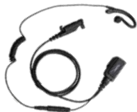
EHN26 Aurifono Micrófono