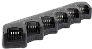
MCL32 Cargador Múltiple para 6 unidades