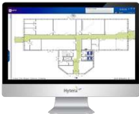
GRATIS Aplicación de control de rondas para vigilancia.

»Modelo: PD-416V-1 VHF 136-174 MHz Potencia: 1/5 W »Modelo: PD-416U-1 UHF 400-470 MHz Potencia: 1/4 W Canales: 256 Precio: US$ 388.00