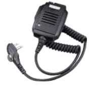
SM13M1 Micrófono bocina IP55 c/control de volumen