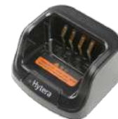
CH10L27 Base de cargador