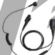
ESN12 Audífono microfono PTT