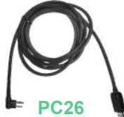
PC26 Cable USB programador