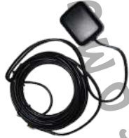
GPS04 Antena GPS 1575 MHz, c/cable 3 m