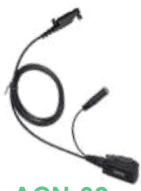
ACN-02 Micrófono con PTT. Requiere EH-01 / EH-02 ES-01 / ES-02