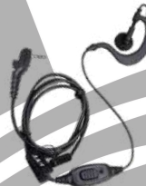
EHS13-A Audífono micrófono con VOX