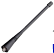
AN0460W19 Antena UHF, 440-470 MHz 15cm