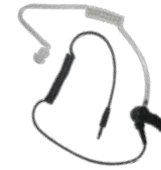
ES-02 Auricular c/ tubo acústico