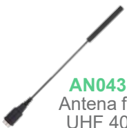
AN0435W11 Antena flexible, UHF 400-470 MHz, 15cm