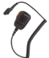
SM18N4-Ex Micrófono Altavoz IS IP54