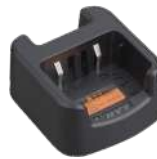
CH10L19 Base p/ cargador