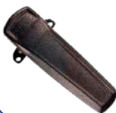
BC08 Clip atornillable con resorte