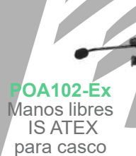
POA102-Ex Manos libres IS ATEX para casco