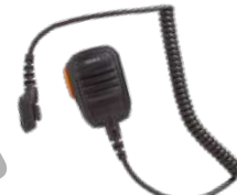
SM18N4-EX Micrófono bocina IP54 Intrínseco