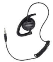
EH-02 Aurifono giratorio