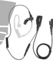
EAN23 Audífono microfono