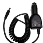
CHV09 Cargador vehicular