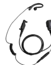
EHN26 Audífono micrófono