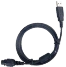
PC37 Cable de programación