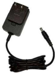
PS1014 Eliminador p/cargador