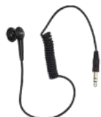
ES-01 Audífono con conector 3.5 mm