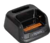
CH10L22 Base de cargador US$ 12.00