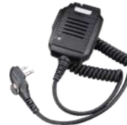
SM13M1 Microfono bocina IP55 c/control de volumen