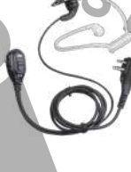
EAM12 Audifono microfono VOX y tubo acustico