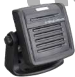
SM09D1 Bocina externa