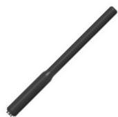
AN0155H13 Antena VHF/GPS 136-174 MHz