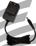
PS1014 Eliminador p/ cargador