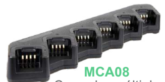
MCA08 Cargador múltiple de 6 baterías