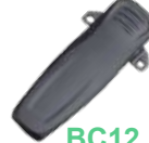
BC12 Clip atornillable con resorte