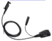
ACN-01 Micrófono con PTT, requiere ES-01/ES-02 EH-01/EH-02