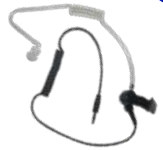
ES-02 Tubo acusti- co c/conector 3.5 mm