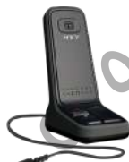
SM10A1 Micrófono de escritorio